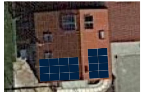
Ost/West mind. 20 Module

Es werden momentan nur Anfragen mit einer oder bei Ost-West Ausrichtung mit 2 Dachseiten angenommen. Gauben oder Fassadenteile werden nicht belegt. Sollte die Anlage zu sehr zerklüftet sein kann leider nicht angeboten werden. Ebenso ist bei Glasvorbauten wie überdachten Terrassen, Erker oder anderen hervorstehenden Bauteilen eine bauseitige Gerüststellung nötig.