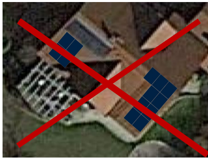
Fläche zu klein

Bitte beachten Sie die Mindestgröße von minimal 18 Modulen Süd oder 20 Stück bei Ost-West Ausrichtung, was ca. 45-50 m 2 freier Nettofläche entspricht. Ein Modul halt derzeit eine Größe von ca. 1,15 x 1,75 m. Es werden maximal 2 zusammenhängende Flächen angeboten.