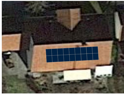
Mindestgröße 18 Module Süd